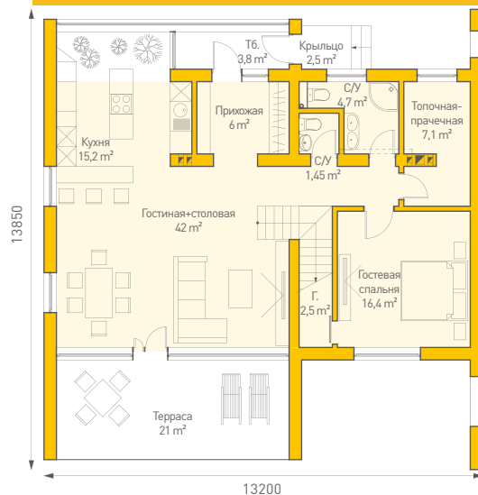
Экспликация | 1 этаж